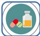
El bon ús dels medicaments