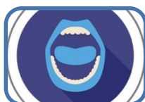
Què cal saber sobre la salut bucodental