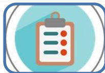
La importància de seguir bé els tractaments