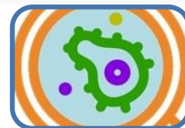
Què cal saber sobre els antibiòtics