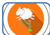
Què cal saber sobre l'insomni