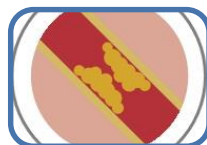
Què cal saber sobre la hipercolesterolèmia